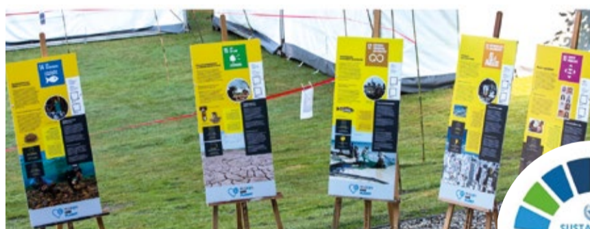
Business as usual steeds minder een optie

menselijke ontwikkeling. Voor bedrijven betekent dit dat 'business as usual' steeds minder een optie is, wil het bedrijf op lange termijn blijven floreren. Feike Sijbesma, voormalig CEO van DSM, legde zijn motivatie voor een duurzame koers altijd uit met: "There are no jobs on a dead planet". Het is dan ook in het belang van werknemers dat een organisatie toekomstbestendig is. Duurzaam wordt snel het nieuwe normaal, en de verwachtingen vanuit de maatschappij worden steeds kritischer. Paul Polman roept bedrijven in zijn boek Net Positive op om niet bij te dragen aan problemen, maar aan de oplossingen van de grote uitdagingen van onze tijd. Hij geeft ook aan dat dat veel kansen oplevert: voor innovatie, nieuwe producten en diensten, nieuwe werkgelegenheid en het aantrekken van duurzame investeerders.