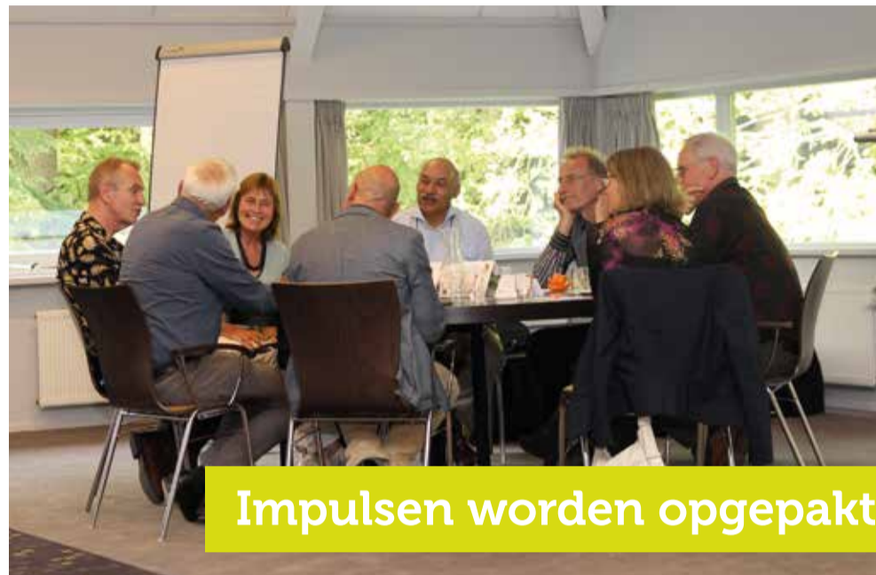
Impulsen worden opgepakt

In het Samenwerken bewegen mensen en organisaties naar elkaar toe, gaan ze de dialoog met elkaar aan en onderzoeken ze wat ze samen kunnen doen voor elkaar, voor anderen, voor de wereld. Als dit lukt schept dat waarde. In het Bezinnen bewegen mensen als het ware naar binnen. Bijvoorbeeld door stil te staan bij de biografie van het landgoed, de biografie van je organisatie en die van henzelf. Wat zijn de