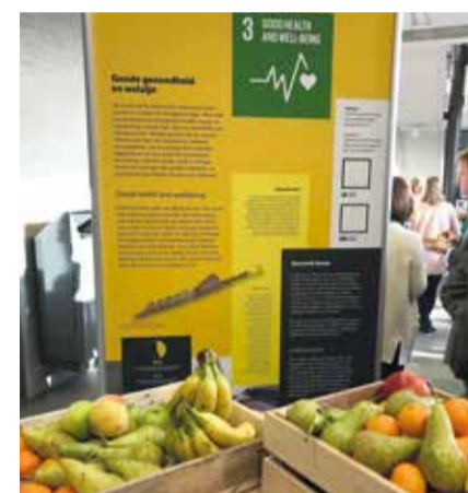
Wilt u de mobiele SDG tentoonstelling op uw congres of in uw bedrijf of onderwijsinstelling? Informeer naar de mogelijkheden op: info@museon.nl